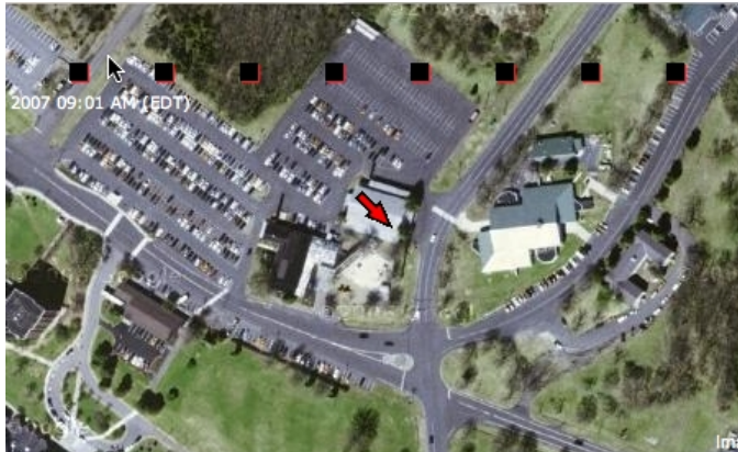
2007 09:01 AM (EDT) Pour trouver Hasan Elahi, cherchez la flèche rouge.

Il commande un sandwich et le prend en photo. Un passage aux toilettes, encore une photo. Un aéroport, une gare, autant de clichés qu'il charge instantanément sur la page qui permet à qui le désire d'observer sa vie quotidienne, étape par étape. Hasan Elahi, 35 ans, artiste Américain originaire du Bangladesh, est au cœur de son propre travail : au fil de dizaines de clichés, il se laisse littéralement suivre à la trace. Jusqu'à l'émetteur GPS qu'il porte en permanence et qui relaie sa position au premier internaute venu.